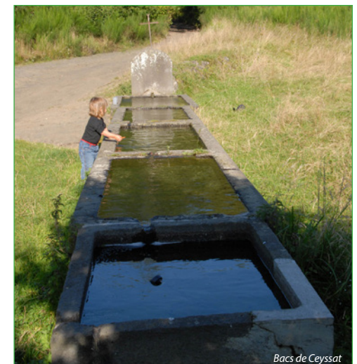
Bacs de Ceyssat

Arrivé à la fin du pré clôturé, choisir sur la droite dans le pré pour rejoindre le point de départ (ne pas passer par le premier chemin à droite avant la clairière qui longe le pré clôturé).