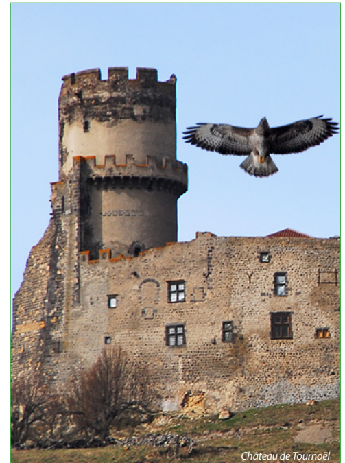
Château de Tournoël

On arrive à un petit parking avec un gros réservoir d'eau. Prendre la route sur la droite, puis à 100 mètres choisir la route à gauche. Après 300 mètres, ne pas manquer l'entrée d'un petit sentier avec accès gratuit au « théâtre de la Forêt » : longueur 600 mètres, durée 1 h. Soit filer tout droit pour rejoindre le point de départ, soit visiter le théâtre, puis en sortant du sentier de découverte partir à droite pour rejoindre le parking.